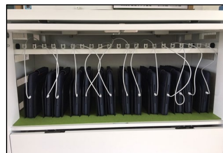
タブレットの充電保管庫

今後は、保護者の皆様に「学習用タブレット端末貸し出しに係る留意事項」を配布いたしますので、お読みいただきご了解のもと活用することになります。生徒には「学習用iPadの利用についての約束」を配布します。保護者の皆様とともに確認し、確認項目にチェックを入れて学校に提出いただくことになります。